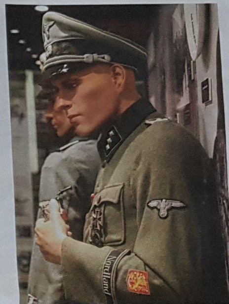
Törni-näyttelyn yhteydessä pyörii myös näyttely suomalaisen Waffen-SS-pataljoonan vaiheista.