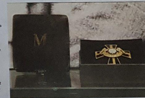
Lauri Törni on Mannerheim-ristin ritari.