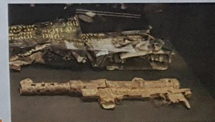
Törnin vanha Carl Gustav m/45 -konepistooli on myös esillä.